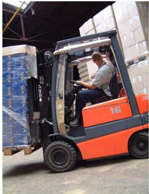
Beérkező áru ellenőrzése