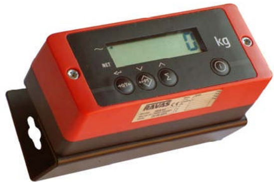
Ütés- és rezgésálló kijelző műszer