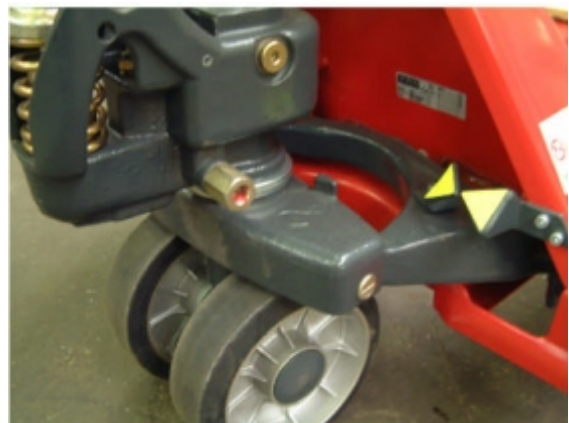
Mérés referencia-magasságban (a legmagasabb ponton)