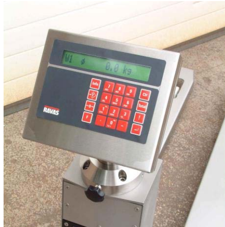
Forgatható mérlegműszer alfanumerikus tasztatúrával és kijelzővel