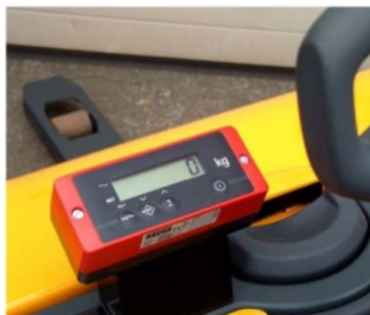
Kompakt digitális kezelőbarát kijelző. Por, víz és rázkódás ellen védve (IP65)